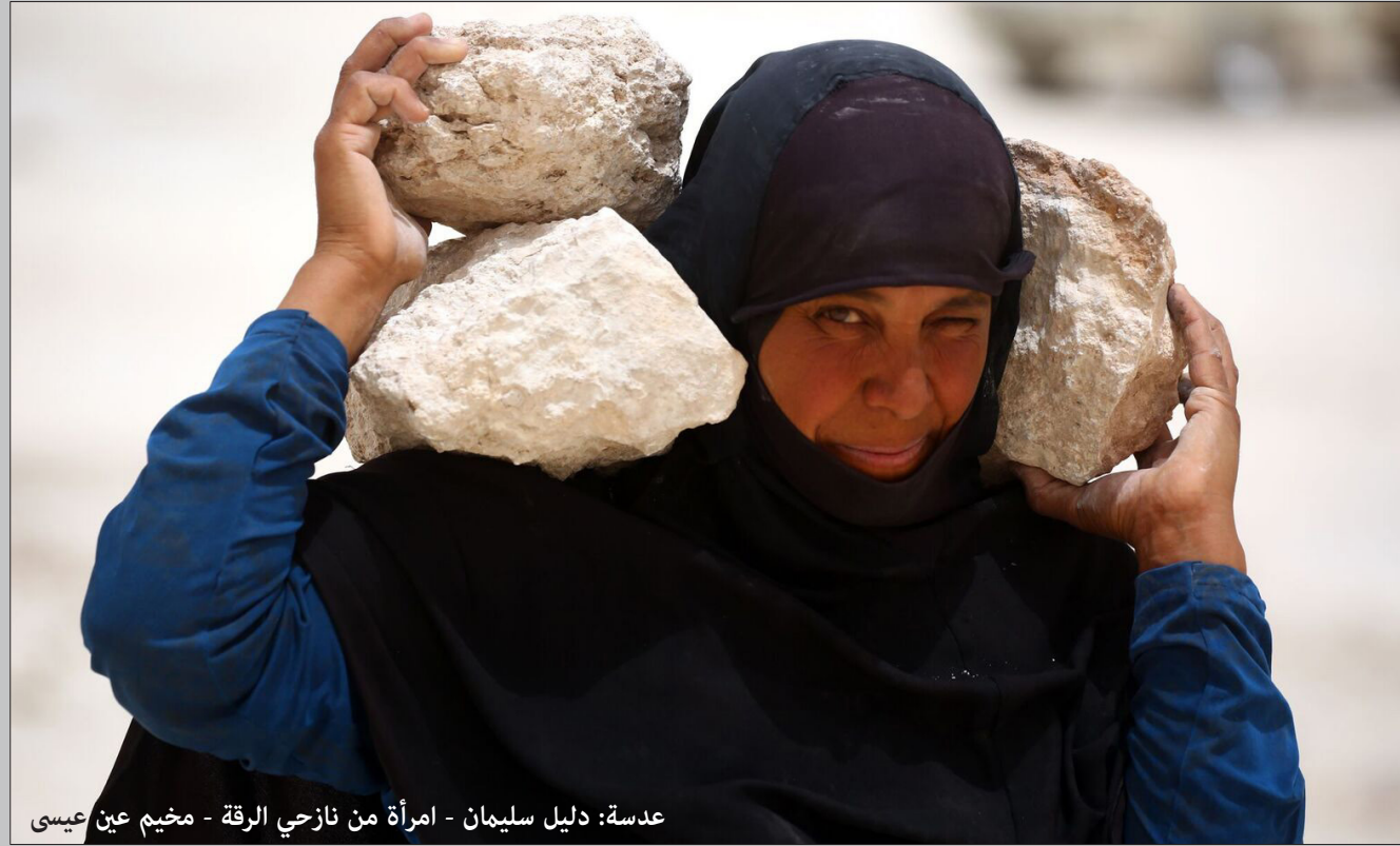
امرأة من نازحي الرقة - مخيم عين عيسى