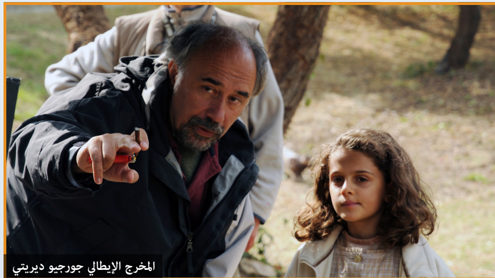
المخرج الإيطالي جورجيو ديريبي

استطاع المخرج بكل حرفة ترجمة قصيدته السينمائية بفيلمه (الرجل الذي سيأتي) بحساسية شاعر سينمائي، التقط المشاهد وعبر عنها، وعلى الرغم من أن الفيلم يميّز بقلّة الحوارات، إلا أنه لا تظهر فيه عيوب في السيناريو، لقد استعاض في كثير من الأوقات بالصورة عن الصوت وحتى عن الموسيقى أحياناً، ولاسيما حين سرد أحداثاً، هي في الأساس تتم بهدوء وسكون، جاعلاً من التشويق فلسفته لمعرفة مصير القرية وأبنائها، وخاصة حينما استخدم الطفلة الخرساء مارتينا التي استعاضت عن كلامها ومأساتها بالكتابة