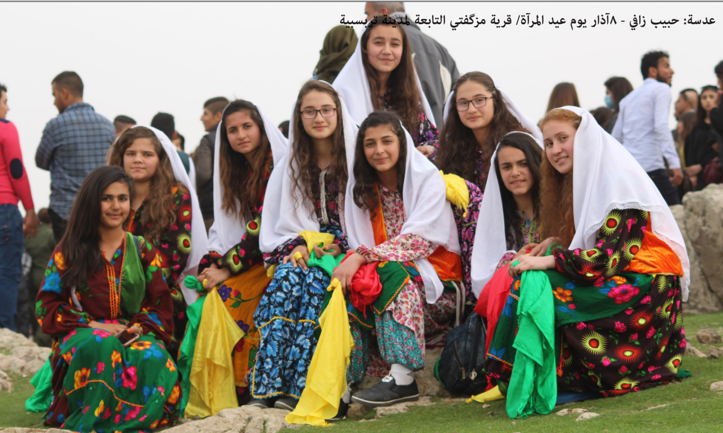
٨ آذار يوم عيد المرأة/ قرية مزغتتي التابعة لمدينة ترسيبة