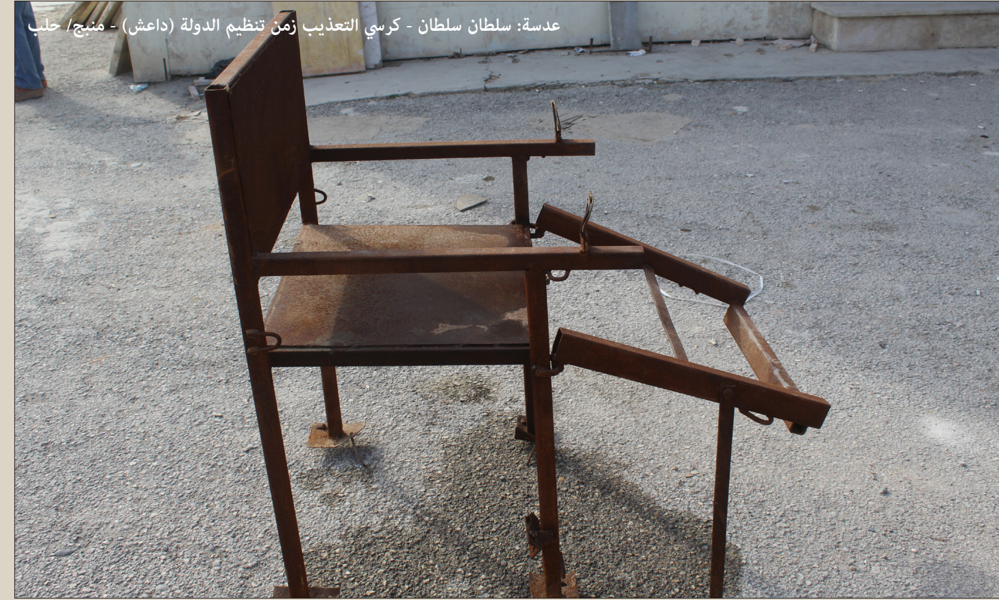
كرسي التعذيب زمن تنظيم الدولة (داعش) - منبج/ حلب