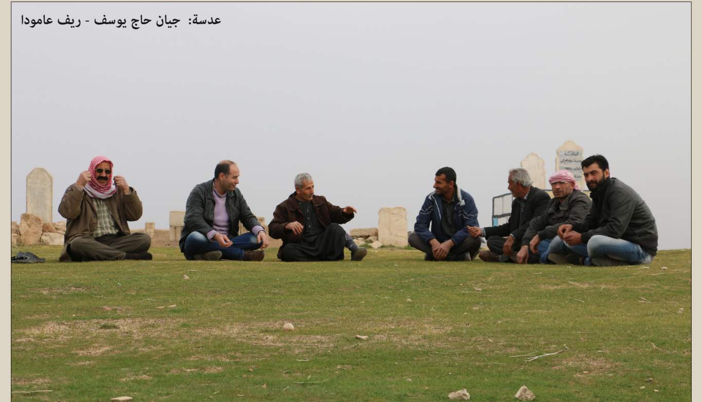
عدسة: جيان حاج يوسف - ريف عامودا